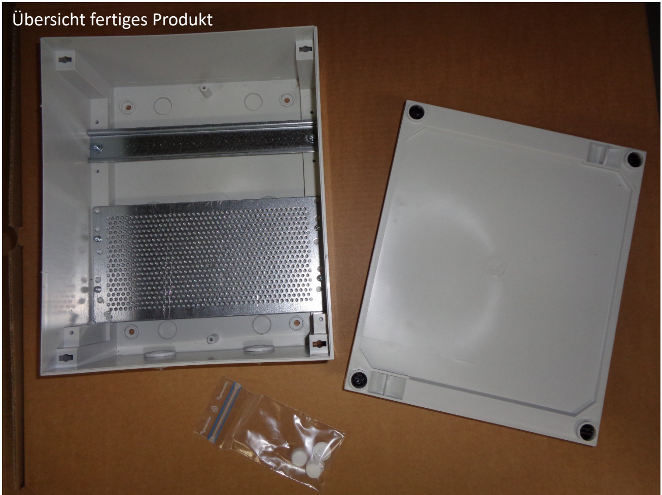
Übersicht fertiges Produkt

Die Bebilderung, dient nur zur Unterstützung, genauere Angaben zu Artikel und Stückzahl ist der Montageliste zu entnehmen.